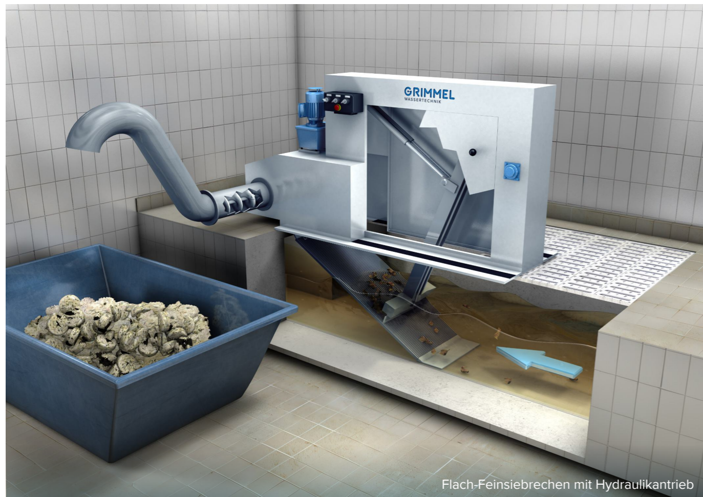
Flach-Feinsiebmaschine mit Hydraulikantrieb