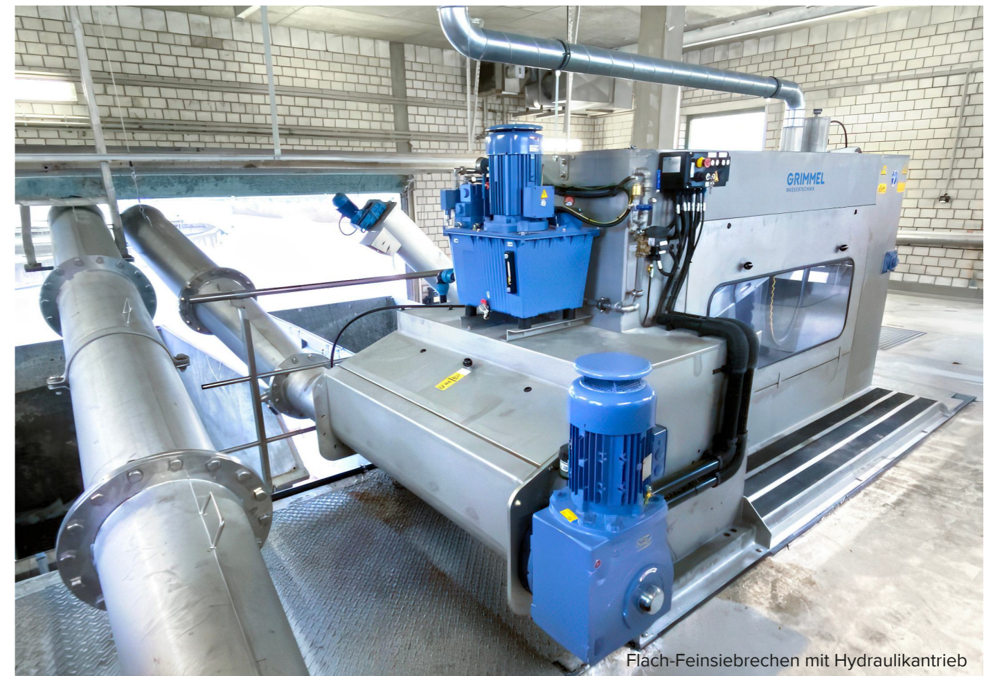
Flach-Feinsiebrecher mit Hydraulikantrieb