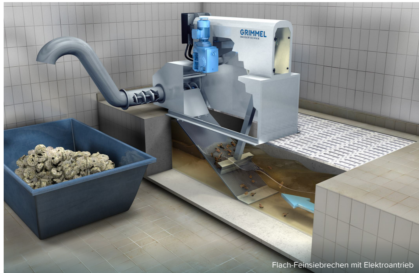
Flach-Feinsiebmaschine mit Elektroantrieb